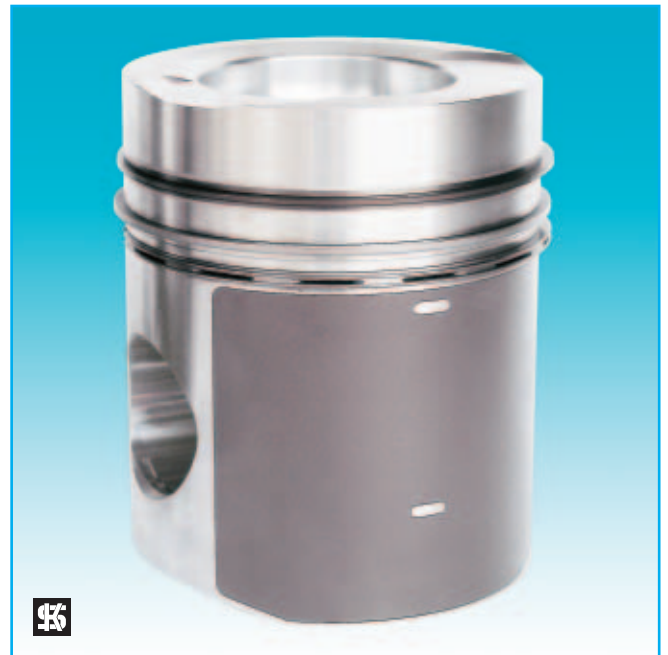
Anterior revestimiento LofriKS®-I