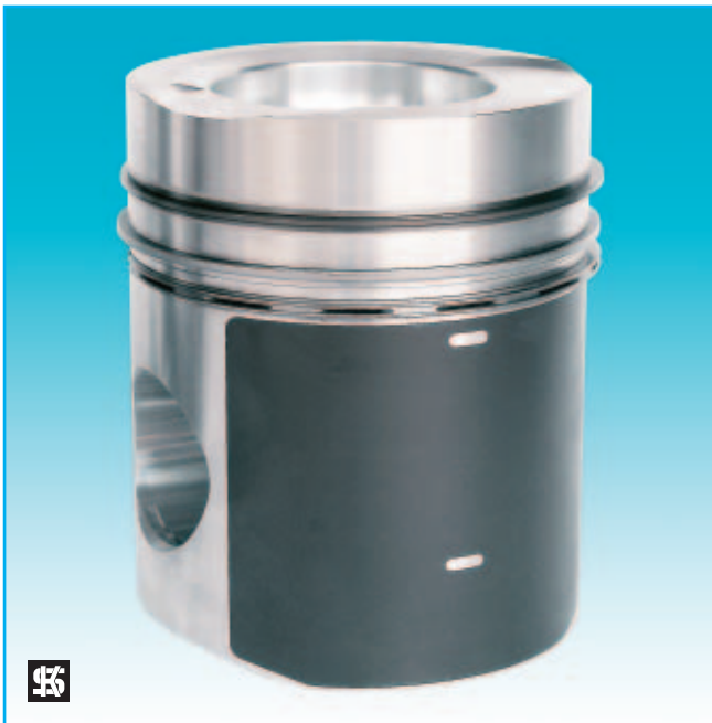
Nuevo revestimiento LofriKS®-II optimizado

El innovativo revestimiento LofriKS® ha sido optimizado por razones de protección del medio ambiente. De ello resultan diferencias visuales, pero no técnicas!