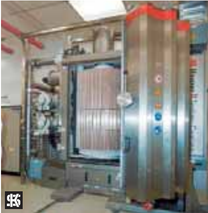
Fig. 3 planta Sputter