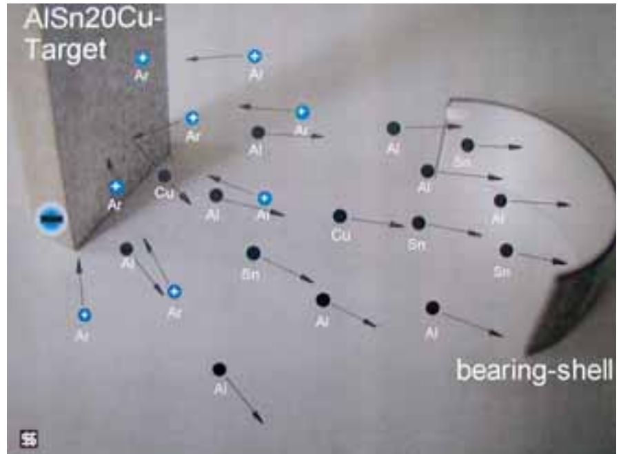
Fig. 2 proceso Sputter