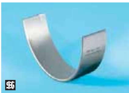
Fig. 1 cojinete casquillo de Sputter KS

Estos cojinetes fueron empleados por primera vez en la construcción moderna de motores en 1989. Con la introducción de los nuevos motores Diesel más potentes y con revoluciones más elevadas la técnica de revestimiento galvánica de las rodaduras enfrentó entonces el problema de que los cojinetes tenían que soportar crecientemente mayores esfuerzos. Por ese motivo se investigaron y desarrollaron nuevos materiales procedimientos de revestimiento para los cojinetes. Con los cojinetes de fricción revestidos de acuerdo con el procedimiento Sputter pudo elevarse la capacidad de soportar esfuerzos hasta un 50% y la resistencia al desgaste empleando las mismas dimensiones y el mismo material.